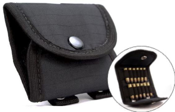
PORTA MUNIÇÃO MODULAR