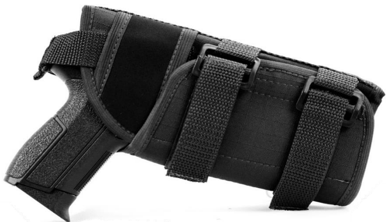
COLDRE MODULAR FORCE