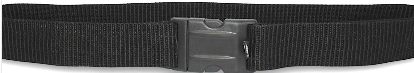
CINTURÃO TÁTICO SECURITY