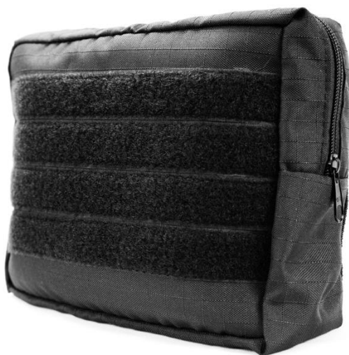
BOLSO HORIZONTAL COM VELCRO