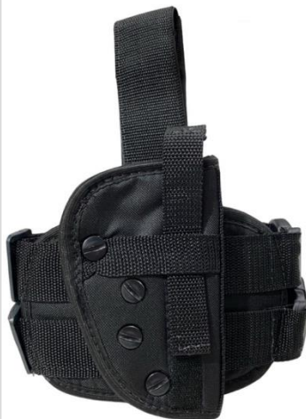
COLDRE DE PERNA TÁTICAL