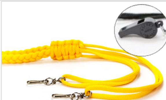
CORDÃO FIEL TRANÇADO e APITO