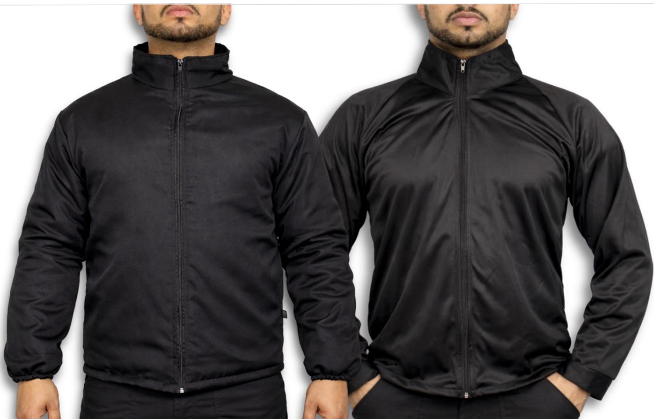
JAQUETAS — VISUAL UNIFORME

Padronização gera percepção de estrutura e profissionalismo.