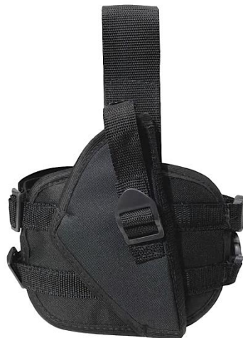
COLDRE DE PERNA