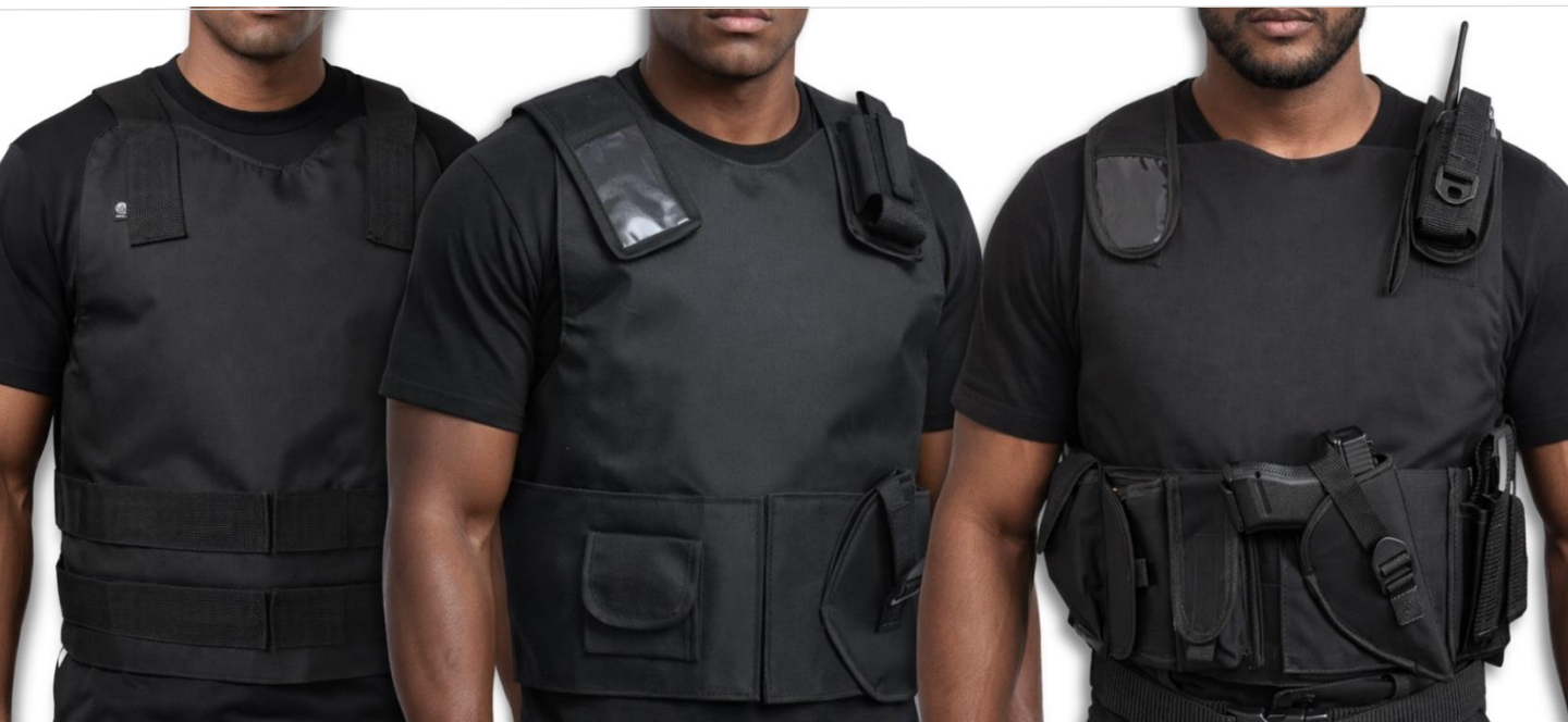
CAPAS DE COLETE — PADRÃO PROFISSIONAL