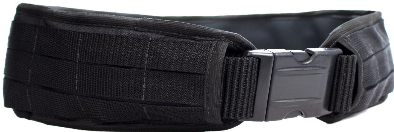
CINTURÃO TÁTICO MODULAR