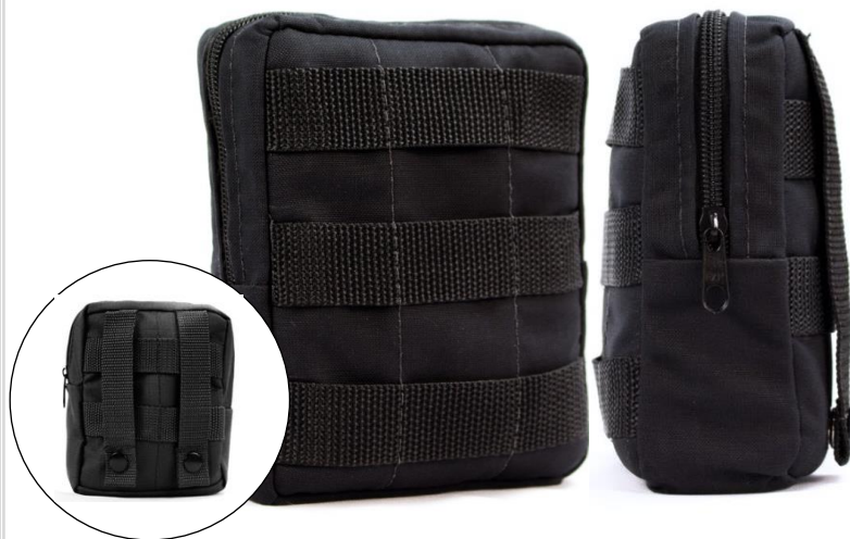
BOLSO VERTICAL COM FITAS